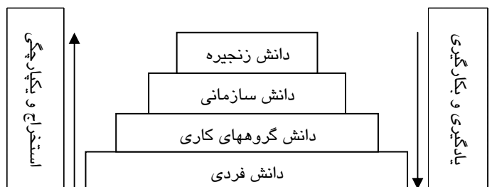
شکل ۲: سلسله مرتب دانش در زنجیره تامین

دانش بدست آمده سرمایه جدید و گرانقیمت سازمان به حساب می آید، و می بایست برای استفاده گروههای مختلف کاری، سازمان و اعضای زنجیره تامین آماده گردد. همانطور که در شکل (۴-۳) پیداست، دانش زنجیره تامین دارای سلسله مراتبی است. استخراج دانش از لایه های پایینی آغاز می گردد و با حرکت به سمت لایه های بالایی دانش دقیقتر و کاملتر می گردد. برای بکارگیری و عملیاتی نمودن دانش می بایست دسترسی لایه های مختلف به دانش های لازم باید صورت پذیرد. از این رو دانش در سازمان باید در چارچوب مشخصی عرضه گردد. در این مرحله دانش به صورت قوانین، دستورالعملها و مستندات طبقه بندی شده در می آید.